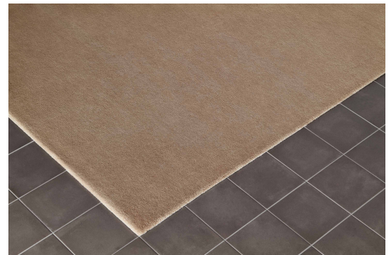
NEW CRAFTON - No.4