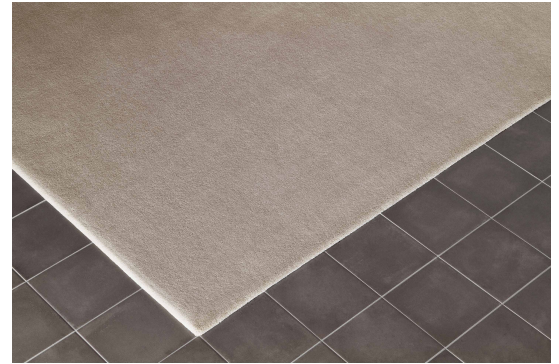
NEW CRAFTON - No.2