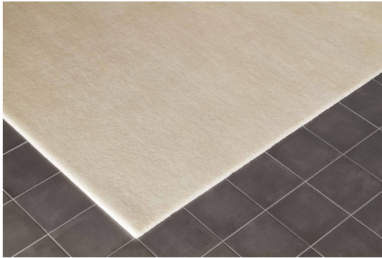
NEW CRAFTON - No.1