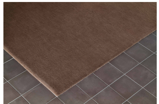
NEW CRAFTON - No.6