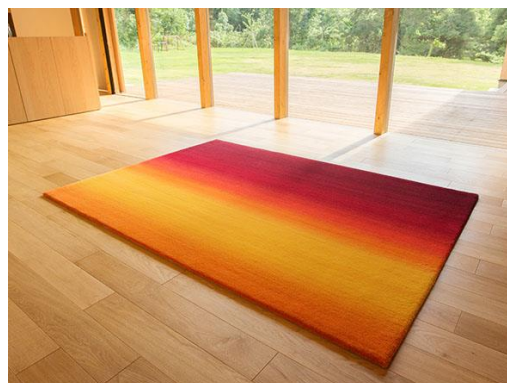
空景シリーズ あけぼの