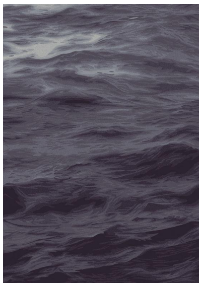
奥山清行氏デザイン