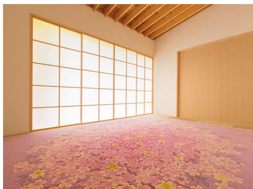
古典ライン 桜花図