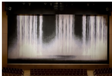
緞帳「水神」は、サイズ20m×9.5m、74色を用いた大型作品で、完成までに約11ヶ月を要しました。

新作「水神」は、11月14日～16日に東京ビッグサイトで開催されるインテリア国際見本市「IFFT/インテリアライフスタイルリビング2018」にて発表予定です。